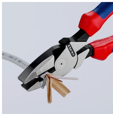
Długie ostrza do cięcia przewodów płaskich