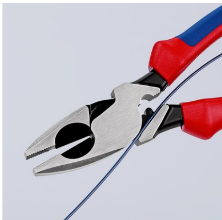
09 11/12 240: ze szczeliną w złączu do przeciągania kabla