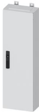
ALPHA 160 DIN AP-Wandverteiler Aufputz Leerschrank IP44 Schutzklasse II H=950mm, B=300mm T=140mm, RAL 9016