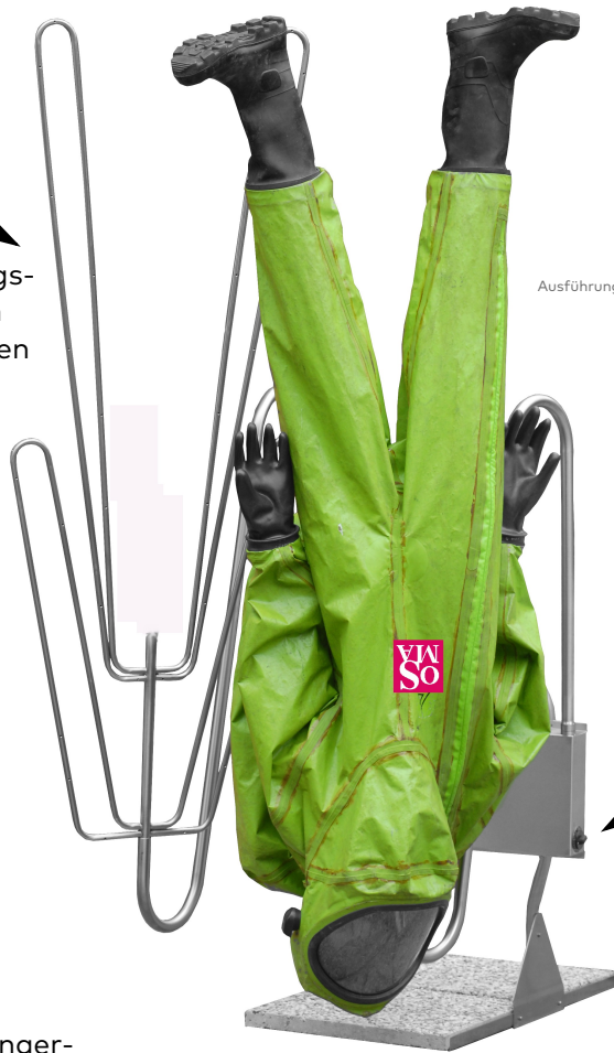
Ausführung HT-102-A als Standgerät

Luft- und wasserdichte Längsverschraubung. Bis zu 20 cm variabel, daher für alle Größen von CSA geeignet.