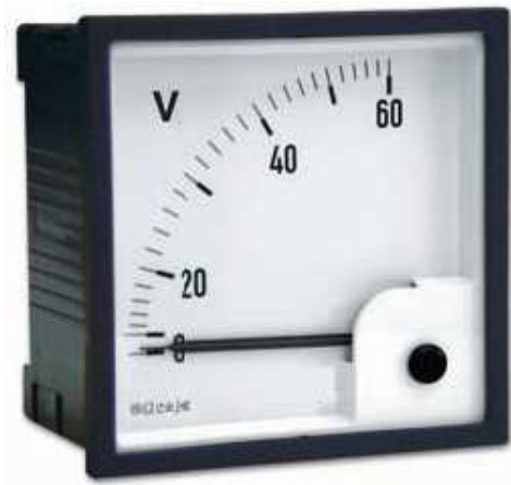
ERC48 | ERC72 | ERC96 | ERC144

48x48 | 72x72 96x96 | 144x144 - DIN 43700 Drehspulmeßwerk 90° oder 240° Klasse 1.5