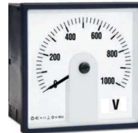
ERCL48 | ERCL72 | ERCL96

48x48 | 72x72 96x96 | 144x144 - DIN 43700 Drehspulmeßwerk 90° oder 240° Klasse 1.5