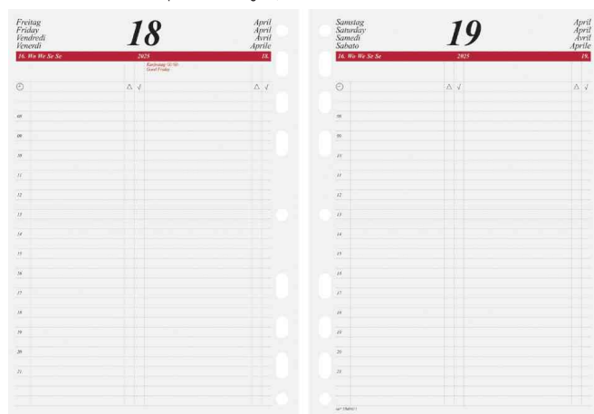
Zubehör: Kalender-Einlage Tageskalender (nicht im Lieferumfang enthalten)