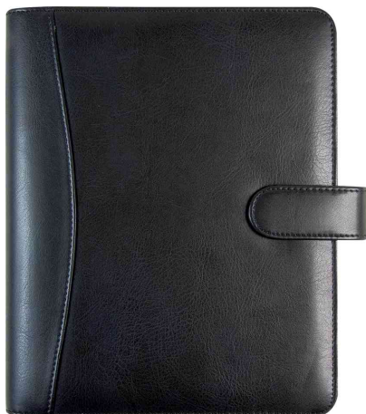
Terminplaner "Timing 2", mit Lasche - Kunstleder-Einband