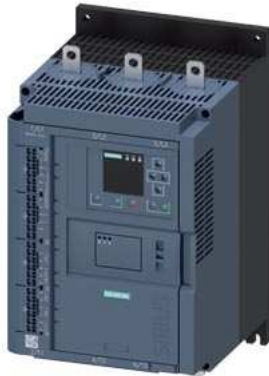
SIRIUS Sanftstarter 200-690 V 143 A, AC/DC 24 V Federzugklemmen