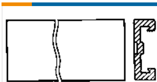
TE Teilnr.:640642-8 08P MTA100 COVER F/T