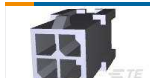
TE Teilnr.:794616-4 FREE HANG DBL ROW HSG 4 POS