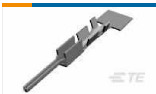
TE Teilnr.:1-794608-0 PIN CONT 20-24 TIN PLATE STRIP