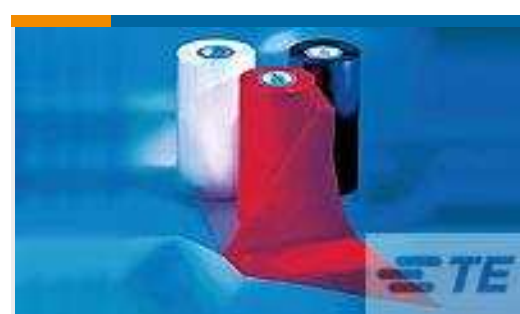
TE Teilnr.:C95590-000 1330-3300-101TT