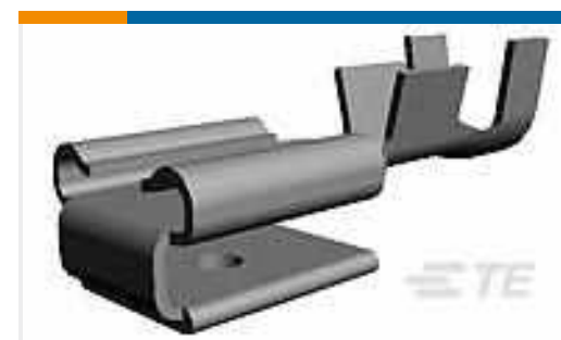
TE Teilnr.:62274-1 250 FASTON REC 22-18 AWG TPBR