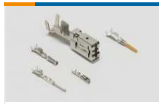
Kontakte für Kraftfahrzeuge(12)