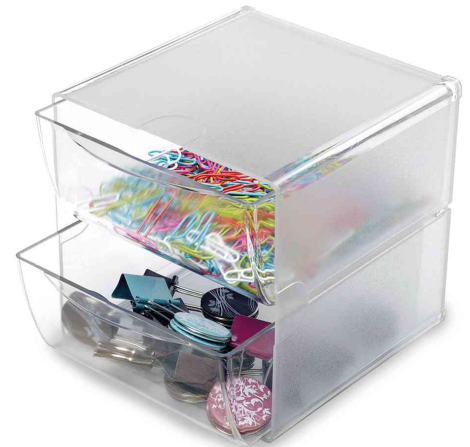
Organisationsboxen Cube, 2 Schubladen