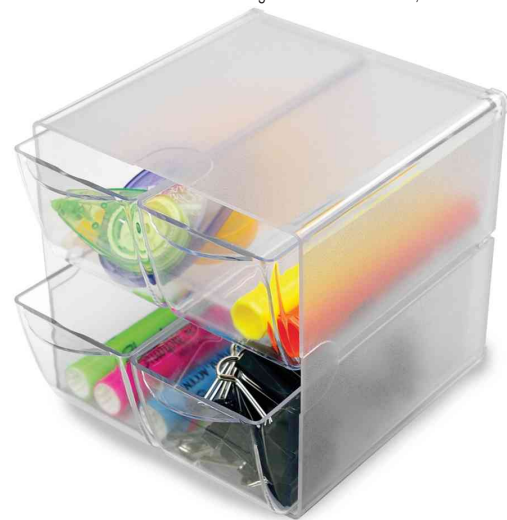
Organisationsboxen Cube, 4 Schubladen