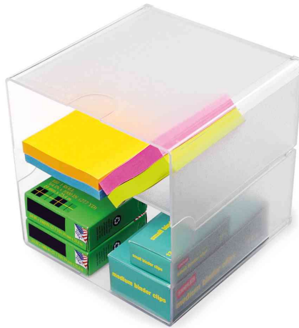
Organisationsboxen Cube, 2 Fächer