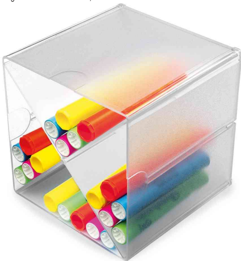
Organisationsboxen Cube, 4 Fächer mit X-Trennung