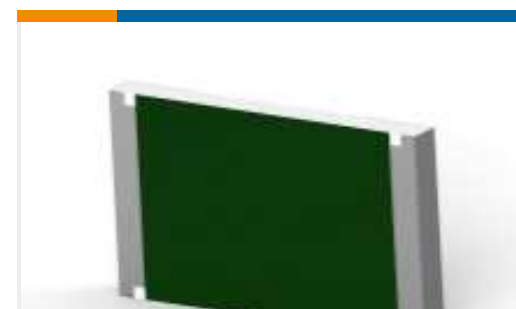
TE Teilnr.:8-2176407-8 3560 27R 5%