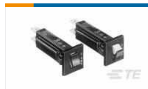
TE Teilnr.:1-1393250-7 W28-XQAT-15=W28