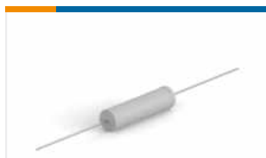
TE Teilnr.:4-2176414-8 7W STD M/OX 5% 1K8