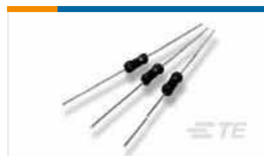
TE Teilnr.:4-1879350-2 RR01 5% 11R AMMO