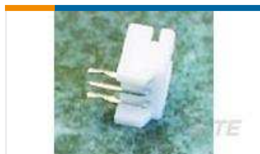
TE Teilnr.:1-440055-1 2.0MM,HDR,11POS,R/A