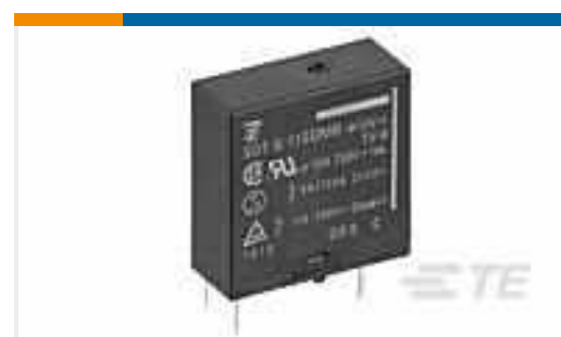
TE Teilnr.:8-1419125-5 SDT-S-106LMR,000