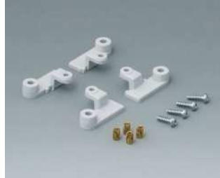
C2299068 Kartenhalter PC (UL 94 HB) lichtgrau RAL 7035

Technische Änderungen vorbehalten. © OKW Gehäusesysteme, Buchen/Deutschland.