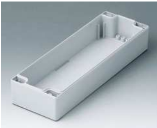
C1082401 Gehäuseschale 80, mit Feder ABS (UL 94 HB) lichtgrau RAL 7035 240x80x40mm