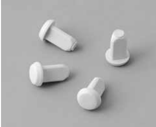
C2299018 Gehäusefüße TPE (UL 94 HB)