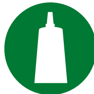
Konfektion / Montage