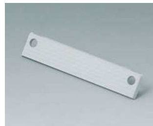
C2210801 Abdeckstreifen 80, mit Aussparung PC (UL 94 HB) lichtgrau RAL 7035