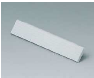
C2200801 Abdeckstreifen 80, ohne Aussparung PC (UL 94 HB) lichtgrau RAL 7035