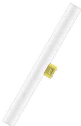
Visuel de référence: Ampoule LED LEDinestra, culot: S14d

Exemples d'utilisation: - idéal pour l'éclairage de miroirs - hôtels, restaurants - particuliers - utilisable à l'extérieur uniquement dans les luminaires adaptés