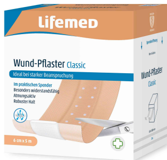
Wund-Pflaster "Classic", 5.000 mm x 60 mm