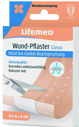
Wund-Pflaster "Classic", 500 mm x 60 mm