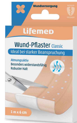
Wund-Pflaster "Classic", 1.000 mm x 60 mm