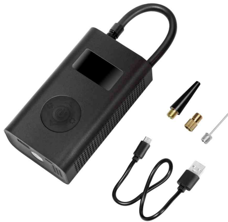
Akku-Kompressor mit LED-Taschenlampe