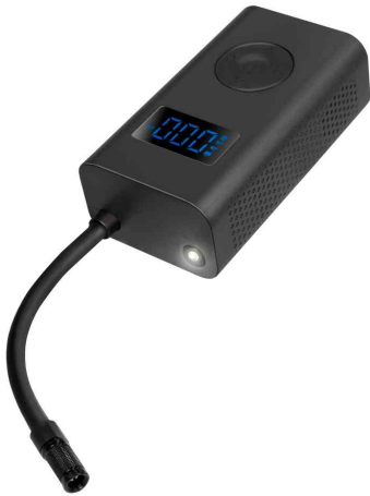
Akku-Kompressor mit LED-Taschenlampe