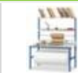
table d'emballage complète, hauteur x largeur x profondeur 850 x 2000 x 800 mm, panneau en acier avec revêtement en plastique résistant à l'usure finition gris clair, piètement 4 pieds en acier avec finition époxy résistante aux chocs et aux rayures en RAL5017 bleu signalisation, 1 dispositif dérouleur/de coupe, 2 tablettes, 8 manches insérables