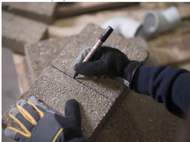
Visuel de référence : présente le produit utilisé sur la pierre