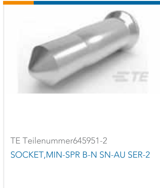
TE Teilenummer645951-2 SOCKET,MIN-SPR B-N SN-AU SER-2