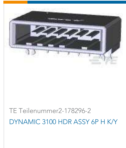
TE Teilenummer2-178296-2 DYNAMIC 3100 HDR ASSY 6P H K/Y