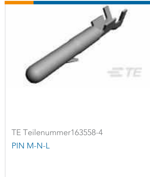
TE Teilenummer163558-4 PIN M-N-L