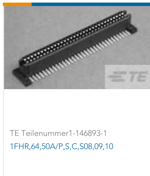
TE Teilenummer1-146893-1 1FHR,64,50A/P,S,C,S08,09,10