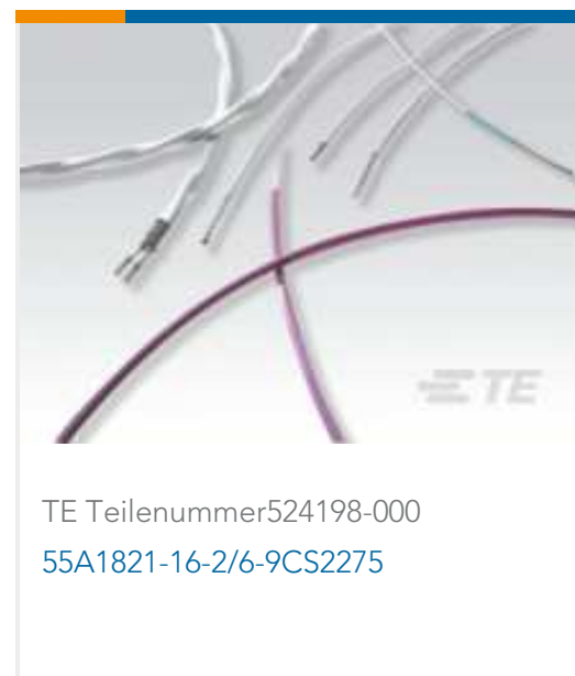
TE Teilenummer524198-000 55A1821-16-2/6-9CS2275