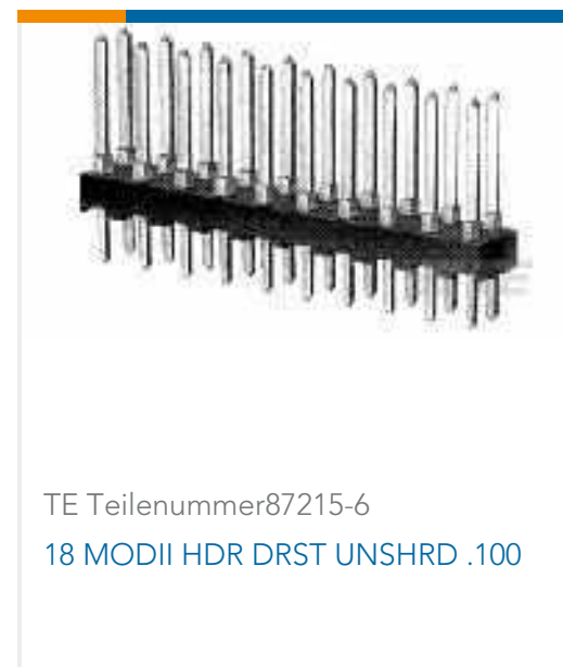
TE Teilenummer87215-6 18 MODII HDR DRST UNSHRD .100