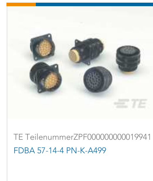
TE TeilenummerZPF000000000019941 FDBA 57-14-4 PN-K-A499