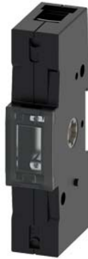
ZUBEHOER FUER 3KD BAUGR 2 NEUTRALLEITER-/ ERDUNGSKLEMME MIT FESTER BRUECKE RAHMENKLEMME