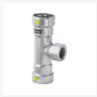
Megapress G-T-Stück mit SC-Contur Modell 4617.2 Artikel 762 919