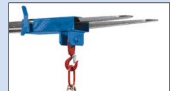
Staplerhaken Typ EZ für Aufnahme durch eine Staplerzinke, Gewicht: 11 kg, Bestell-Nr. 115-189-J9