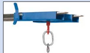
Staplerhaken Typ DZ für Aufnahme durch beide Staplerzinken, Gewicht: 29 kg, Bestell-Nr. 115-190-J9