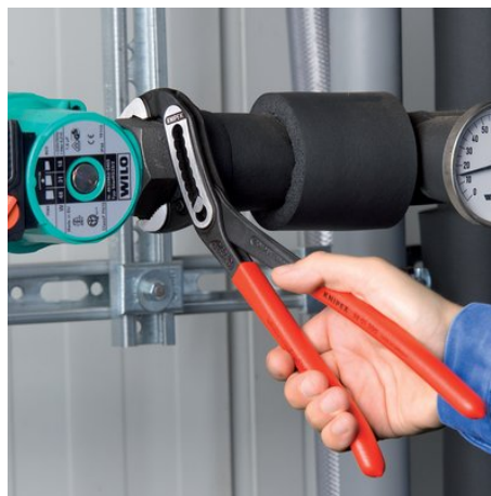
Autoserrante per tubi e dadi: nessuno scivolamento sul pezzo; l'intera capacità di azionamento può essere applicata per ruotare i pezzi; non è necessario premere con forza i manici della pinza, quindi minore sforzo