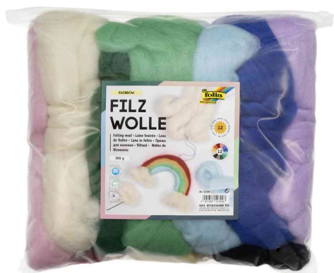
Laine feutrée RAINBOW