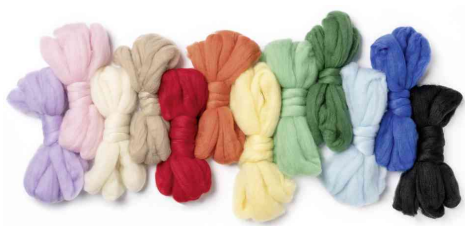
Aperçu des couleurs