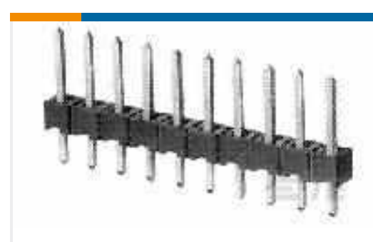
TE Teilnr.:826629-4 4P AMPMODU II PIN HSG