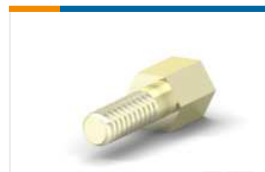
TE Teilnr.:1393560-5 C42334A 383C911=SUB D BOLZEN A