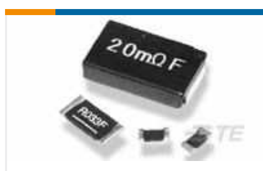
TE Teilnr.:1625827-9 TL3A R047 1%