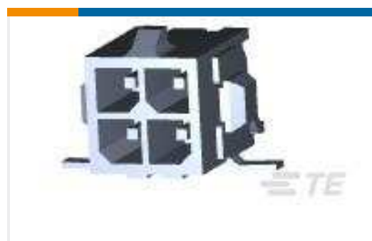
TE Teilnr.:3-794627-4 04P MICRO MNL ASSY,RA ,SMT, LF