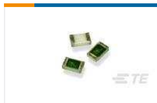
TE Teilnr.:1-1879215-8 CPF 0402 6K04 0.1% 25PPM 1K RL