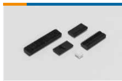
Kabel-an-Leiterplatte-Steckverbindersätze und -gehäuse(5)