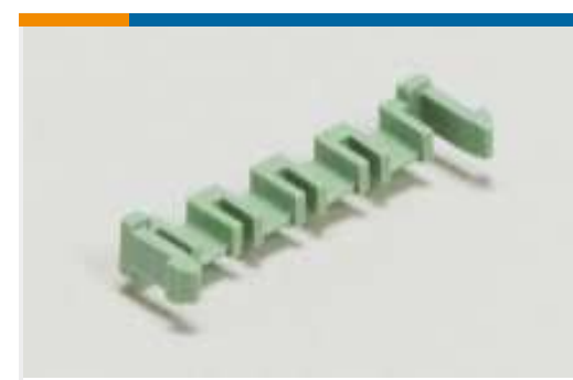
Laschen, Verriegelungen und Arretierungen für Leiterplatten(1)