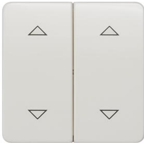
DELTA PROFIL, TITANWEISS WIPPE MIT JALOUSIESYMBOLEN F.TASTER 2-FACH MITTELSTELLUNG 65X65MM