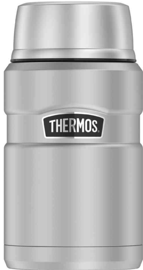
Réceptif alimentaire STAINLESS KING, argent