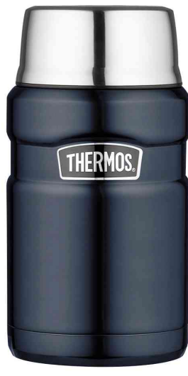
Réceptif alimentaire STAINLESS KING, bleu foncé