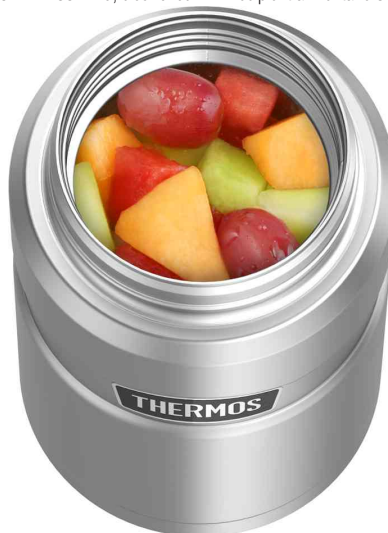
Visuel de référence: maintient chaud et froid