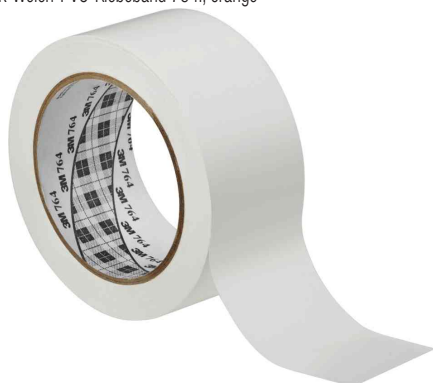
Allzweck-Weich-PVC-Klebeband 764I, weiß