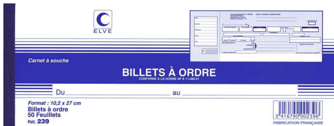
Billets à ordre