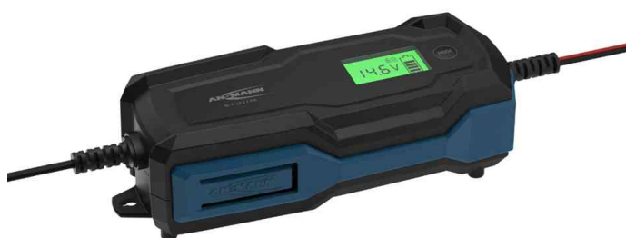
Chargeur de batterie pour voiture BC