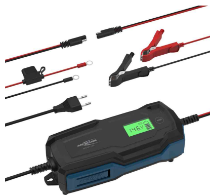
Chargeur de batterie pour voiture BC, avec accessoires