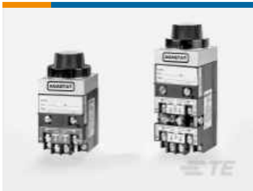
TE Teilnr.: 1423162-5 7022AC=RLY,STD,OFF,2P 120VAC,1