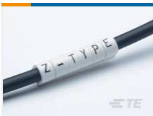
TE Teilnr.:EC0437-000 06153411