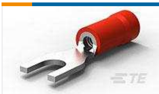
TE Teilnr.:342117-1 22-16 F.E.P.G. SPADE 4BA STUD