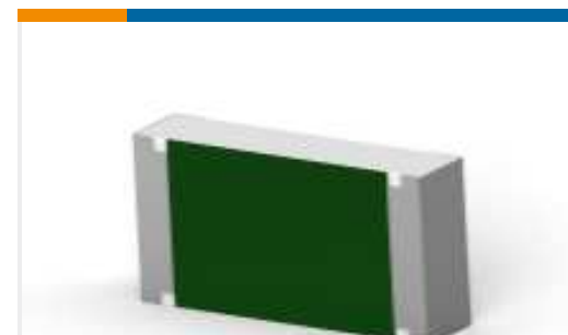
TE Teilnr.:2176398-2 3502 15K 1%