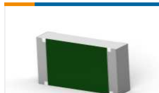
TE Teilnr.:9-2176397-8 3502 11K 1%