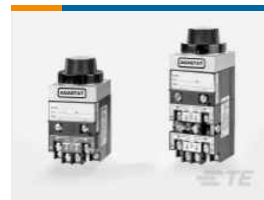
TE Teilnr.:9-1755142-8 7022OBIM=RLY,OFF,2P,24V,5S,I,M