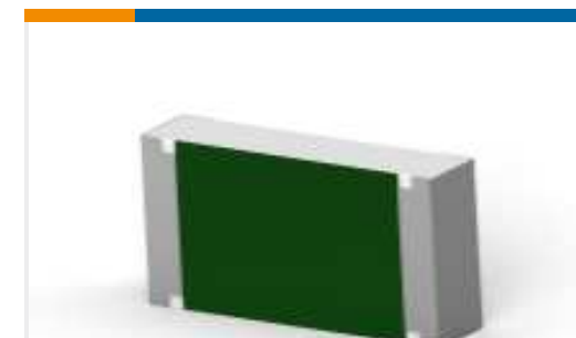
TE Teilnr.:1-2176398-4 3502 47K 1%