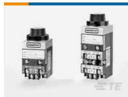
TE Teilnr.:1755170-1 7022OCIM=RLY,STD,OFF,2P,24V,15S,I, M