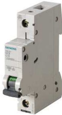
Leitungsschutzschalter 230/400V 6kA, 1-polig, B, 6A