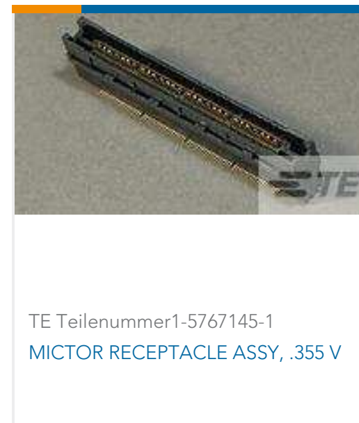
TE Teilenummer1-5767145-1 MICTOR RECEPTACLE ASSY, .355 V