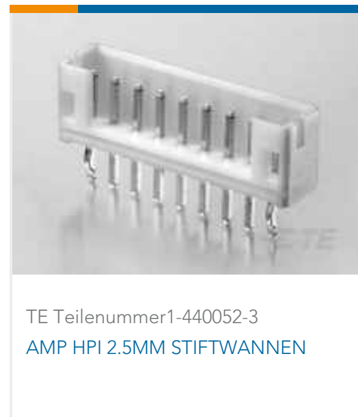
TE Teilenummer1-440052-3 AMP HPI 2.5MM STIFTWANNEN