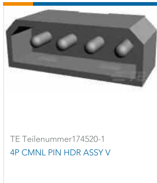
TE Teilenummer174520-1 4P CMNL PIN HDR ASSY V