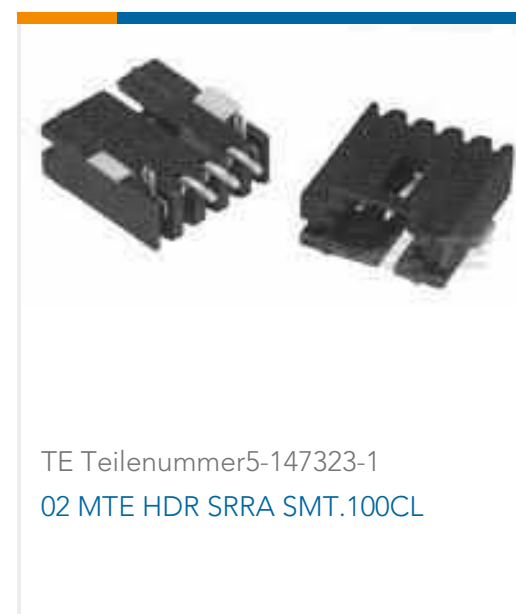
TE Teilenummer5-147323-1 02 MTE HDR SRRA SMT.100CL