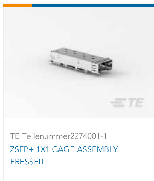
TE Teilenummer2274001-1 ZSFP+ 1X1 CAGE ASSEMBLY PRESSFIT