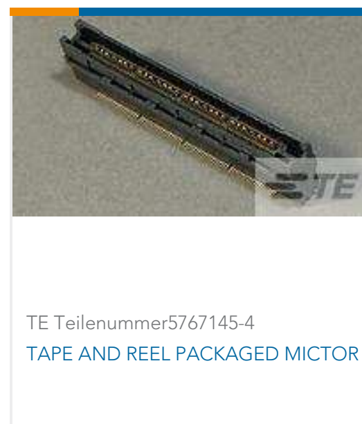
TE Teilenummer5767145-4 TAPE AND REEL PACKAGED MICTOR