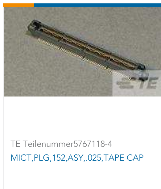
TE Teilenummer5767118-4 MICT,PLG,152,ASY,.025,TAPE CAP