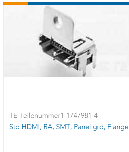
TE Teilenummer1-1747981-4 Std HDMI, RA, SMT, Panel grd, Flange