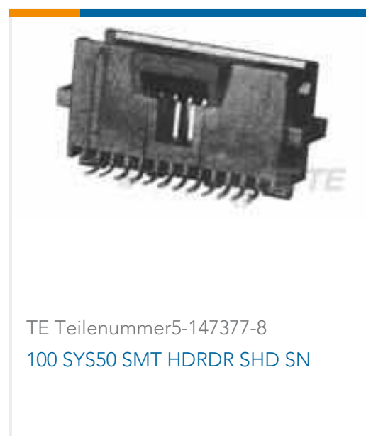
TE Teilenummer5-147377-8 100 SYS50 SMT HDRDR SHD SN