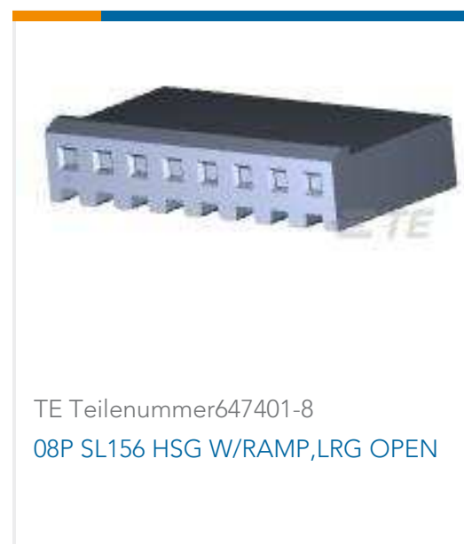
TE Teilenummer647401-8 08P SL156 HSG W/RAMP,LRG OPEN