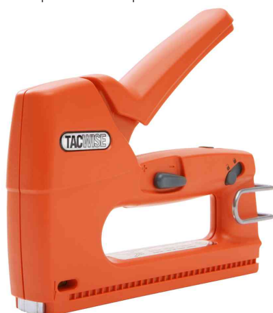
Agrafeuse & cloueuse Z3-140L