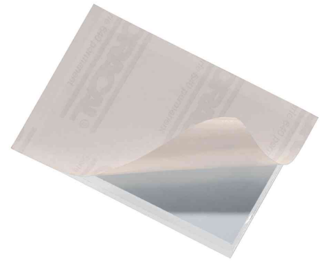
Selbstklebetaschen POCKETFIX®, Rückseite