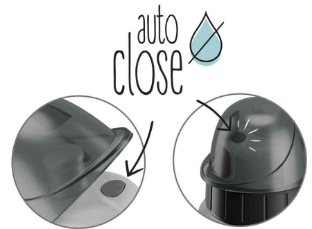
Detail: Auto Close Verschluss