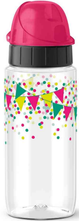
Motiv: Pink Bänderole