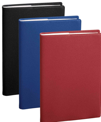
Agenda "Ministre S", assorti