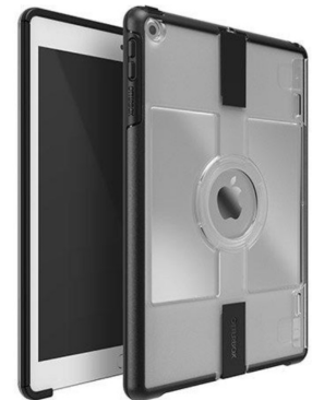
Negro/Clear 77-65159 840104212929