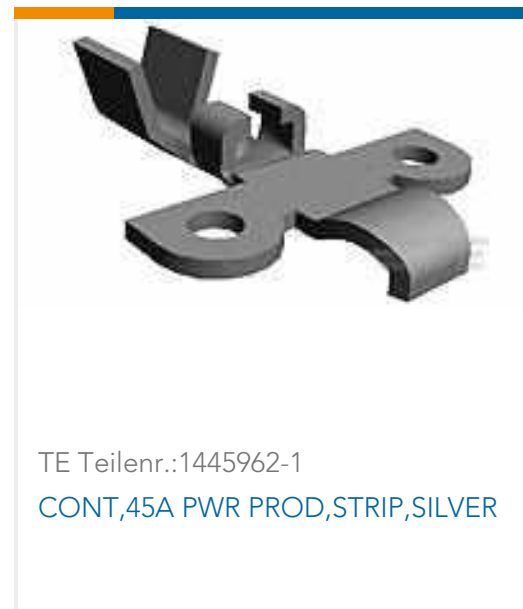
TE Teilnr.:1445962-1 CONT,45A PWR PROD,STRIP,SILVER