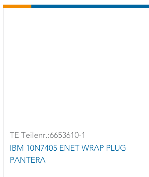
TE Teilnr.:6653610-1 IBM 10N7405 ENET WRAP PLUG PANTERA