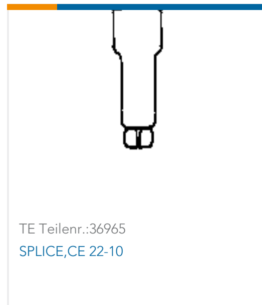
TE Teilnr.:36965 SPLICE,CE 22-10