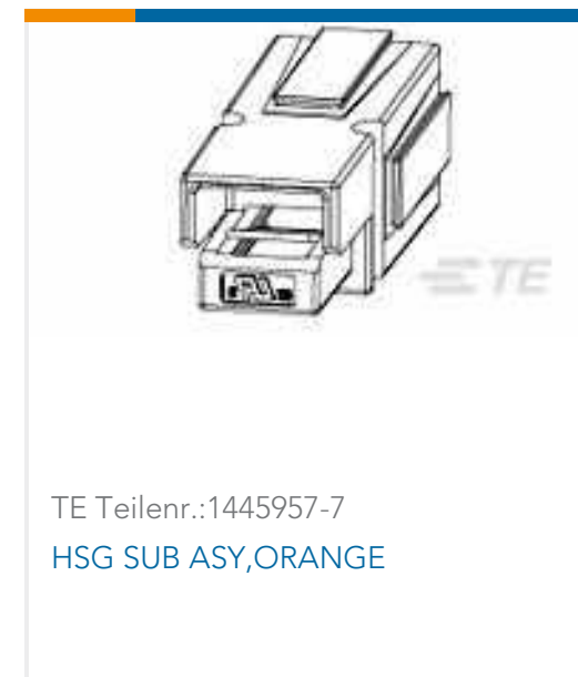
TE Teilnr.:1445957-7 HSG SUB ASY,ORANGE