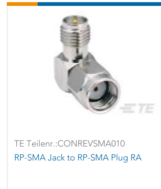
TE Teilnr.:CONREVSMA010 RP-SMA Jack to RP-SMA Plug RA