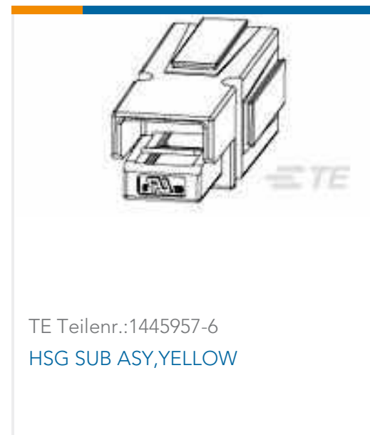
TE Teilnr.:1445957-6 HSG SUB ASY,YELLOW