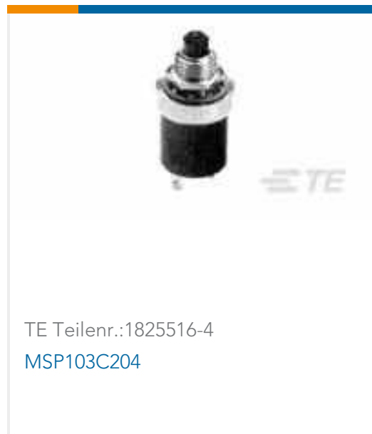
TE Teilnr.:1825516-4 MSP103C204