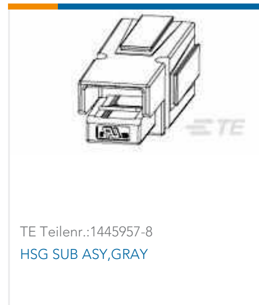
TE Teilnr.:1445957-8 HSG SUB ASY,GRAY