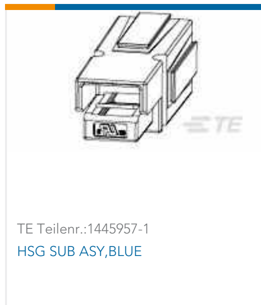
TE Teilnr.:1445957-1 HSG SUB ASY,BLUE