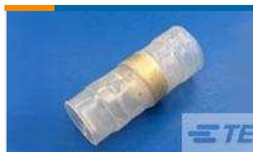
TE Teilenummer696453-000 B-053-70