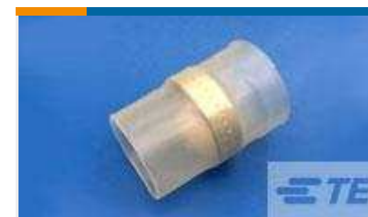
TE Teilenummer696437-000 B-051-00-01