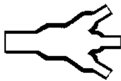
TE Teilenummer299698-000 462A011-25/225-0