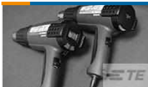
TE Teilenummer CJ2087-000 HL2010E-KIT-120V