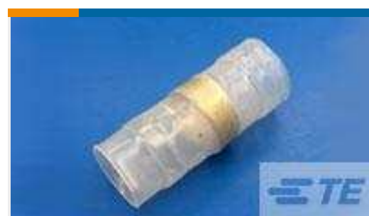
TE Teilenummer312172-000 B-053-70-01