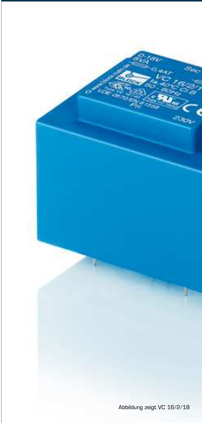
Abbildung zeigt VC 16/2/18