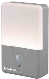
Motion Sensor Outdoor Light