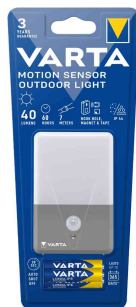
Motion Sensor Outdoor Light, 1er Pack