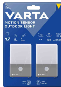
Motion Sensor Outdoor Light, 2er Pack