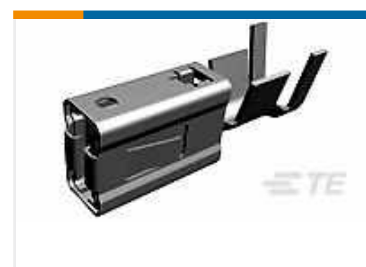
TE Teilnr.:1241404-3 AMP MCP 6.3/4.8K, CONTACT