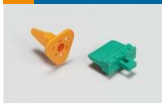
Arretierungen und Positionssicherungen(7)