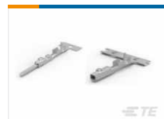
TE Teilnr.:1718762-3 MCON, BUCHSE UND FLACHSTECKER