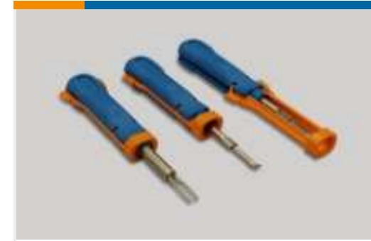
Einsetz- und Entriegelungswerkzeuge (13)