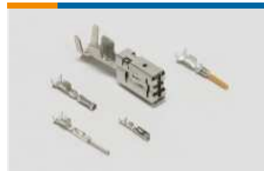
Kontakte für Kraftfahrzeuge(125)