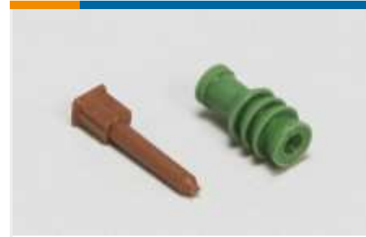
Dichtungen und Blindstopfen(6)