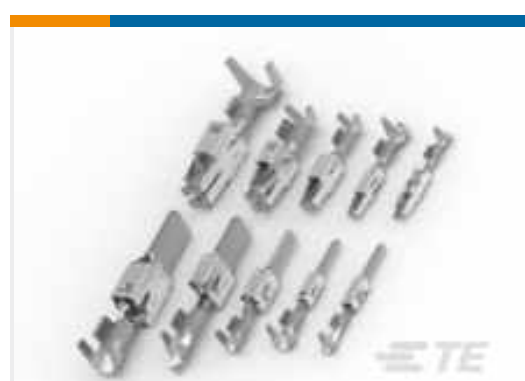
TE Teilnr.:965914-1 TIMER, BUCHSE UND FLACHSTECKER