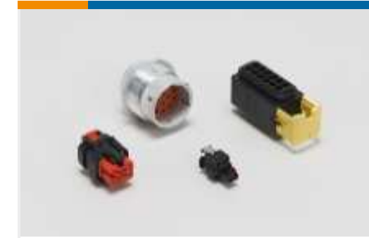
Gehäuse für Kraftfahrzeuge(352)