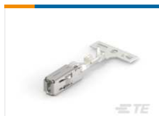
TE Teilnr.:1-2141857-3 AMP MCP 2.8, CONTACT