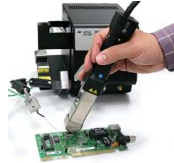
HYBRID TOOL – schnell, einfach und sicher manuell Entlöten