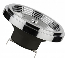
145703 LED Spot R111/ES111 G53 12V DIM 9W (75W) 620lm 927 24D Bridge