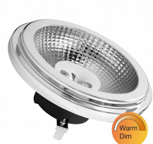
143850 LED WarmDim AR111 G53 12V 9W 40D 927-918