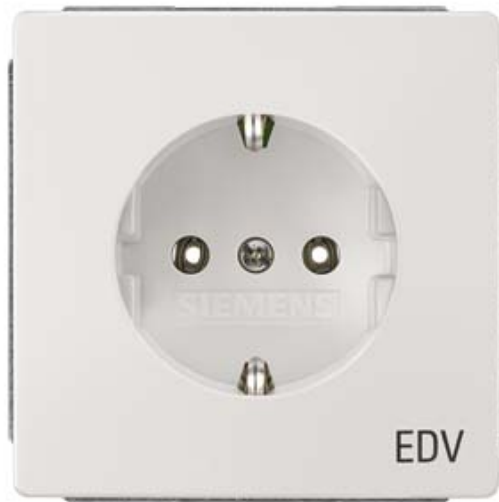
DELTA STYLE SCHUKO-STECKDOSE 10/16A 250V MIT AUFDRUCK EDV TITANWEISS