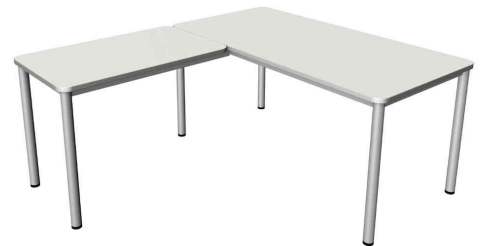
Schreibtisch "Prime" mit Anbau, weiß