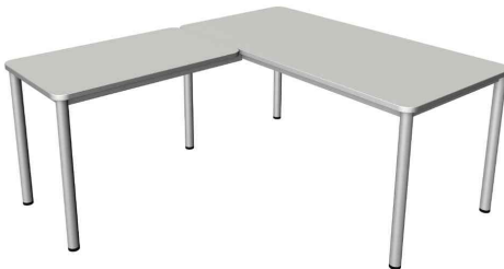
Schreibtisch "Prime" mit Anbau, lichtgrau