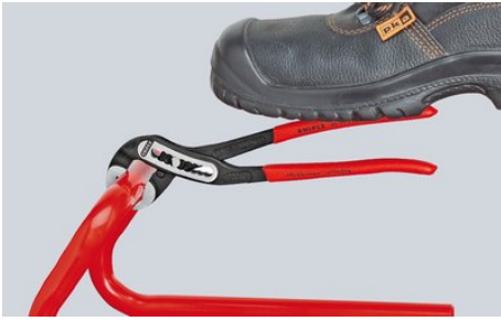
Autobloqueante en tuberías y tuercas: agarre perfecto en la pieza de trabajo; toda la fuerza realizada se centra en el trabajo sobre la pieza. Se disminuye la fuerza requerida.