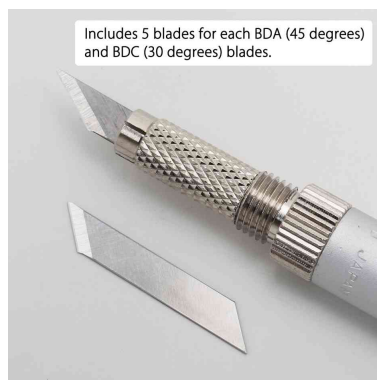
Visuel de référence : vue détaillée de la lame