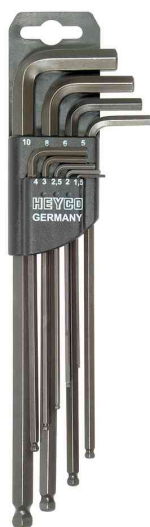
Jeu de clés Allen à tête ronde pour 6 pans creux