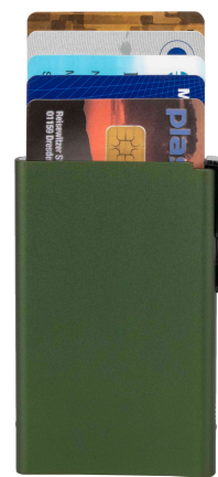
Visuel de référence : Utilisation du produit