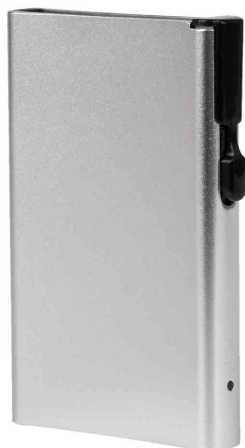
Porte-cartes avec bouton-poussoir & protection RFID, argent