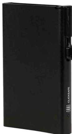
Porte-cartes avec bouton-poussoir & protection RFID, noir