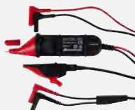
Kelvin Clip & Sonde

Die Kelvin Clips / Kelvin Sonden verbinden niederohmige Widerstände (z. B. Kontaktwiderstände, Shunts, ...) mit einem Widerstandsmessgerät in Vierleitertechnik. Dadurch wird der Zuleitungswiderstand kompensiert.